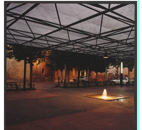
PLAZA DOCTOR AZUERO