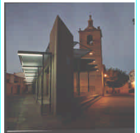
IGLESIA SAN JUAN BAUTISTA